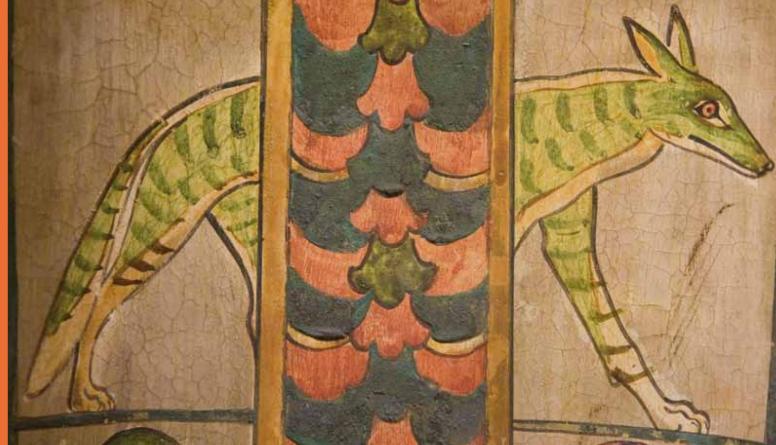
Hyène, peinture sur cartonnage, Troisième période intermédiaire, Paris, Musée du Louvre.