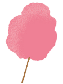
la barbe à papa