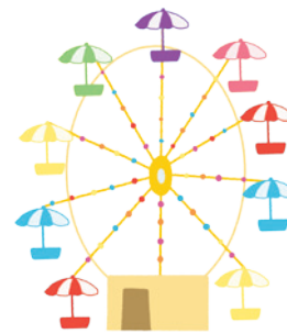
la grande roue