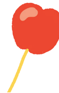
la pomme d'amour