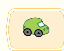
La petite voiture