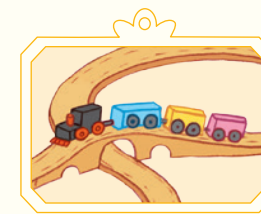
Le petit train