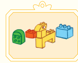
Le jeu de construction