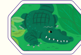
Le crocodile du Siam