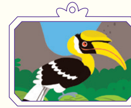
Le calao bicolore