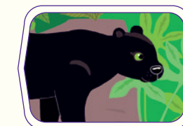
La panthère noire