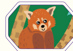
Le panda roux