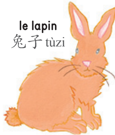
le lapin 兔子 tùzi