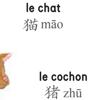
le cochon 猪 zhū