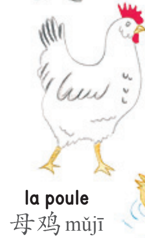
la poule 母鸡 mǔjī