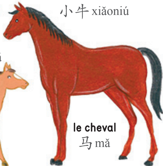
le cheval 马 mǎ