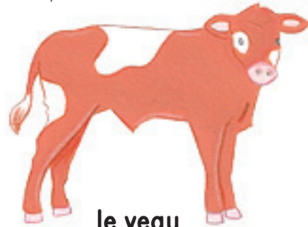
le veau 小牛 xiǎoniú