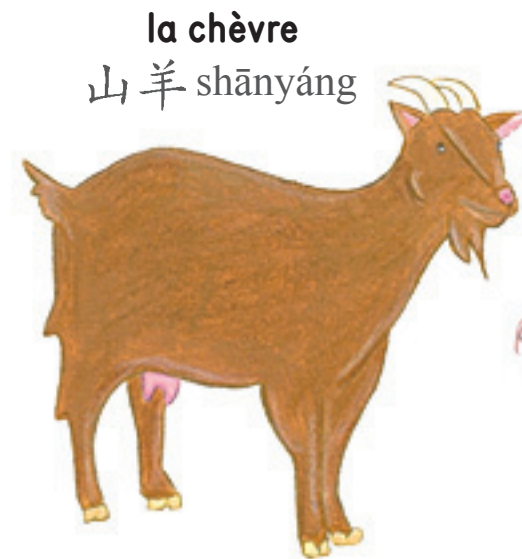
la chèvre 山羊 shānyáng