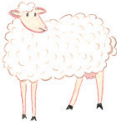
la brebis 母羊 mǔyáng