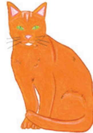
le chat 猫 māo