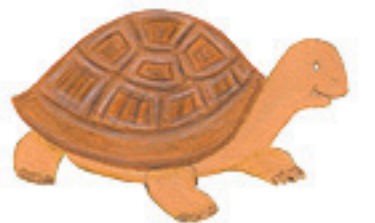
la tortue 乌龟 wūguī