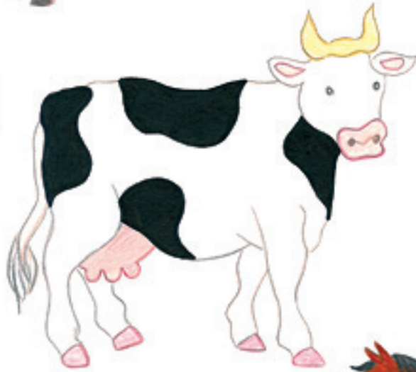
la vache 奶牛 nǎiniú