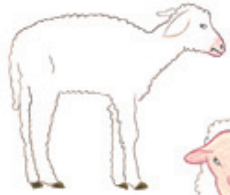
l'agneau 小羊 xiǎoyáng