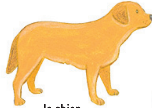
le chien 狗 gǒu