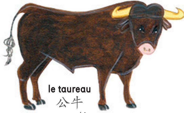
le taureau 公牛 gōngniú