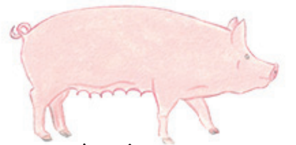
la truie 母猪 mǔzhū