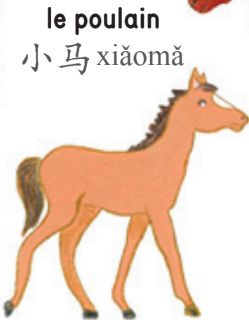
le poulain 小马 xiǎomǎ