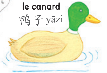
le canard 鸭子 yāzi