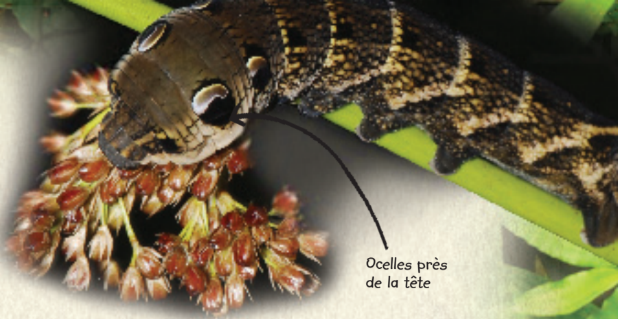
Ocelles près de la tête

Les ours polaires sont plus blancs quand ils sont jeunes.