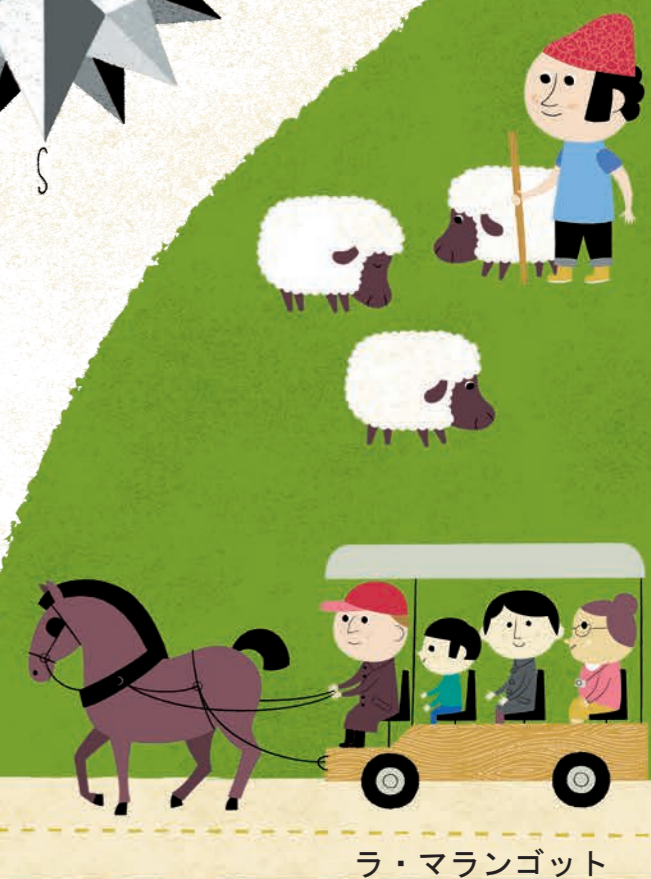
ラ・マランゴット