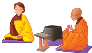
La prise de refuge

Chez les chrétiens, la confirmation par l'enfant des vœux prononcés lors du baptême lui permet de communier et de recevoir l'eucharistie. Elle a lieu à des moments différents selon les Églises. Pour les catholiques, elle précède ou suit la communion solennelle (cérémonie mise en place au xvii e siècle pour renforcer le sentiment d'appartenance). Les orthodoxes la pratiquent après le baptême, et la nomment « chrismation ». Dans les deux cas, l'enfant reçoit l'huile sainte sur le front, symbole de son nouveau statut.