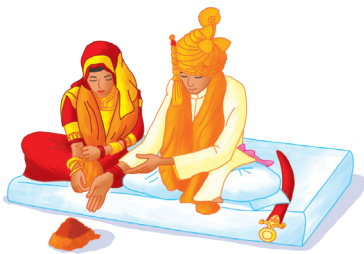
Le mariage hindou

Dans l'islam et le bouddhisme, le mariage n'est pas sacré. Il peut se dérouler n'importe où. En islam, il est validé par un tuteur, qui vérifie les moyens financiers du mari et s'assure de l'engagement sincère. Dans les mariages bouddhistes, ce sont les parents qui donnent leur accord : les époux font des vœux de bon comportement.