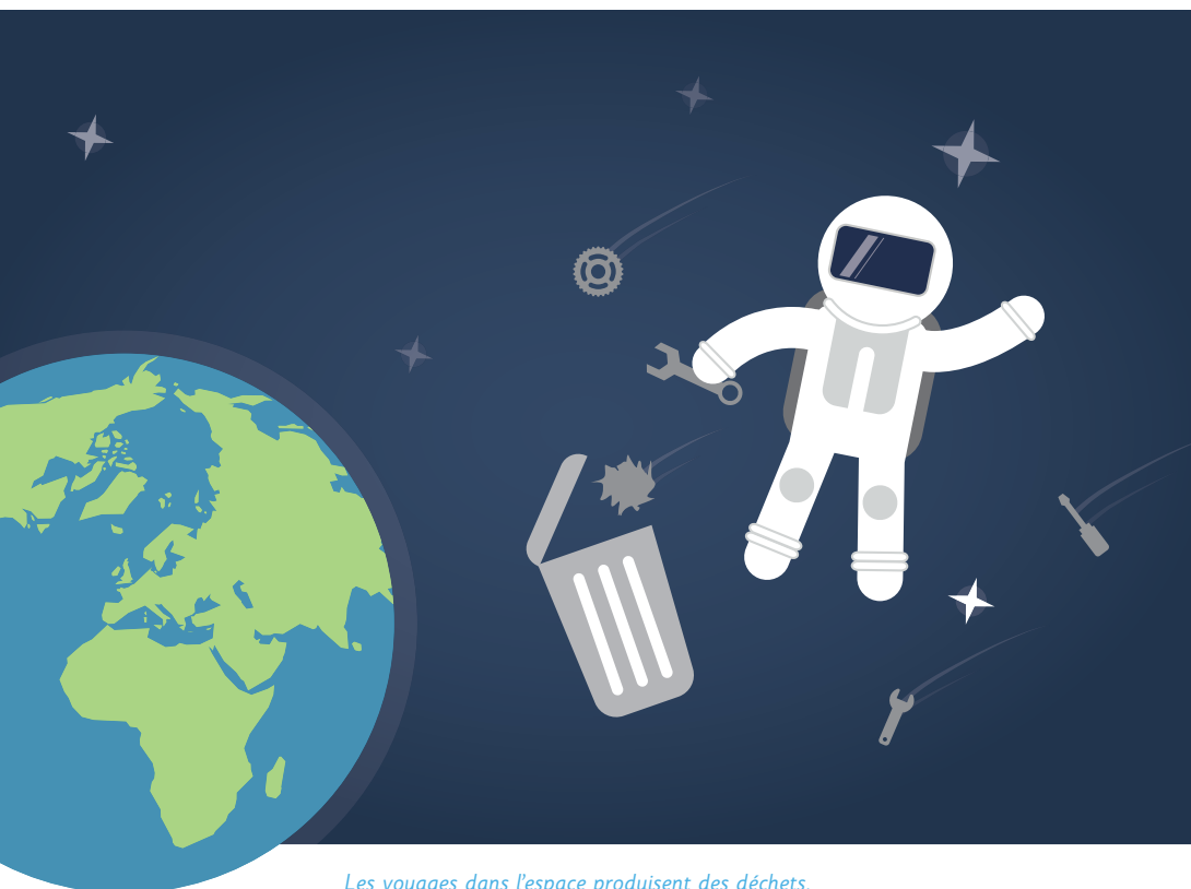
Les voyages dans l'espace produisent des déchets.

L'espace n'appartient à personne mais l'homme va dans l'espace. Il y laisse donc sa trace. Dans l'ISS (la Station spatiale internationale), il y a toujours trois astronautes au moins.