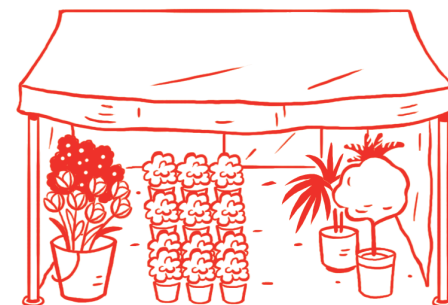
le magasin de fleurs