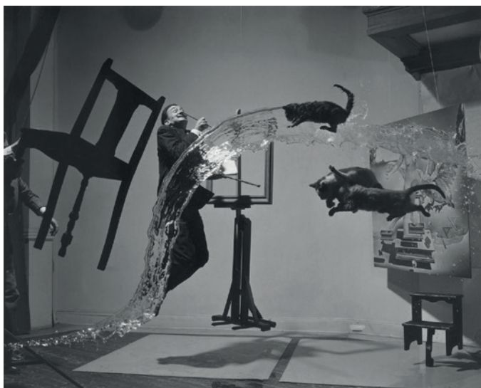
Composition photographique de Philippe Halsman mettant en scène l'artiste Salvador Dalí, 1948

Le surréalisme a été un mouvement majeur, car il a rappelé que l'artiste est avant tout un rebelle et un homme libre. Il a aussi permis d'ouvrir à l'art les portes de l'imaginaire et du rêve.