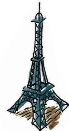
the Eiffel Tower