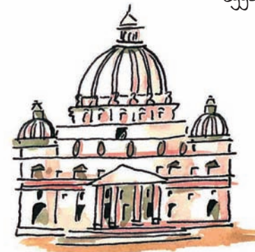
St Peter's in Rome