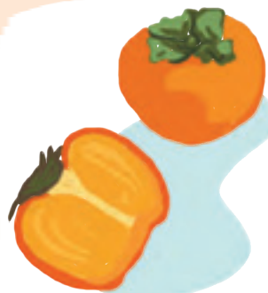
LE KAKI 柿 - kaki

Mot japonais, de ju , « souplesse », et do , « la voie ». Sport de combat d'origine japonaise, encore très pratiqué.