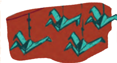
L'ORIGAMI 折り紙 - origami « oligami »

Mot japonais, de ori , « plier », et kami , « papier ». L'origami est l'art traditionnel japonais du papier plié.