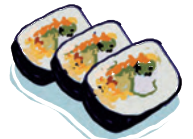
LES SUSHIS 寿司 - sushi « souchi »

Mot japonais, de ori , « plier », et kami , « papier ». L'origami est l'art traditionnel japonais du papier plié.