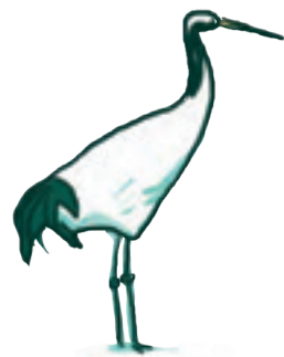
LA GRUE DU JAPON 鶴 - tsuru « tsoulou »

Mot japonais. Poupées japonaises au corps cylindrique, originaires du nord du Japon. Les kokeshis étaient à l'origine fabriquées en bois et de manière artisanale.