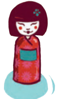
LES KOKESHIS 小芥子 - kokeshi « kokéchi »

Mot japonais. Vêtement ample issu de la tradition japonaise, maintenu par une large ceinture. Les kimonos sont à présent portés pour les grandes occasions.