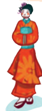
LE KIMONO 着物 - kimono

Mot japonais. Vêtement ample issu de la tradition japonaise, maintenu par une large ceinture. Les kimonos sont à présent portés pour les grandes occasions.