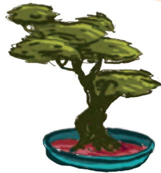
LE BONSAÏ 盆栽 - bonsai « bonsai »

Le cerisier en fleur parfume la rue où se pressent les piétons : une écolière se dirige vers le magasin où des kokeshis modernes aux yeux malicieux sont exposées ; il est même possible d'y croiser une jeune femme en kimono... Les enseignes proposent toutes sortes de restaurants décorés d'oiseaux en origami de toutes les couleurs.