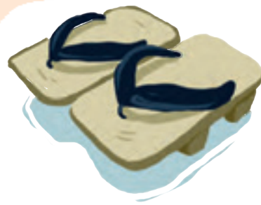
LES CHAUSSURES 履き物 - hakimono

De bon , « arbre », et sai , « pot ». Arbre miniature de tradition japonaise cultivé en pot.