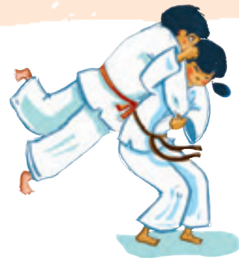
LE JUDO 柔道 - juudoo « djououdoo »

La grue du Japon est l'un des plus grands oiseaux du monde. Elle figure parmi les représentations d'origami les plus célèbres.